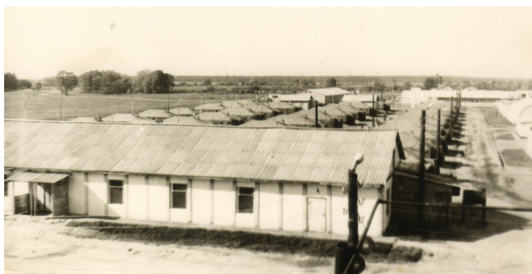
Ростовский полк в/ч11350, 1986 год

После взрыва на 4 энергоблоке начался сильный пожар. Первыми были вызваны пожарники. Работали они в обычной экипировке без средств