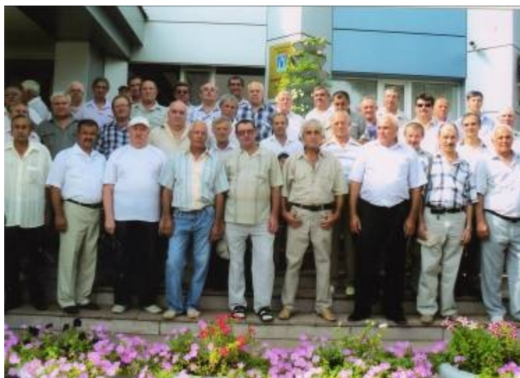
Фото на память после награждения 2011 год