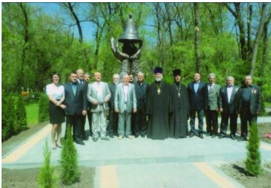
Открытие памятника 26 апреля 2014 года

В Батайске в честь героев-чернобыльцев установлен памятник. Памятник скульптора, заслуженного художника России, Академика Российской Академии художеств, участника ликвидации аварии на Чернобыльской АЭС, батайчанина Исакова Сергея Михайловича. (фото возле памятника слева).