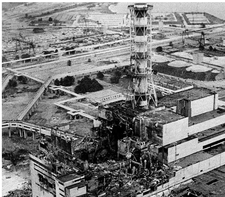
Чернобыльская атомная электростанция им. В.И.Ленина.

Авария расценивается, как крупнейшая в своем роде за всю историю атомной энергетики, как по количеству погибших и пострадавших от её последствий, так и по экономическому ущербу.