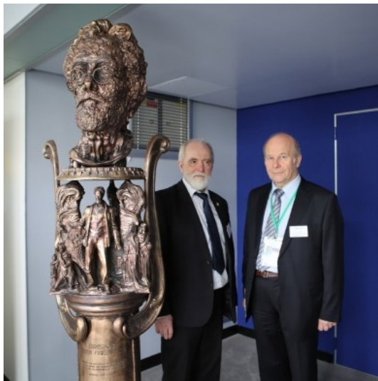
Бюст А. П. Чехова в Баденвейлере

– С чем связан выбор для своего творчества именно религиозной темы?