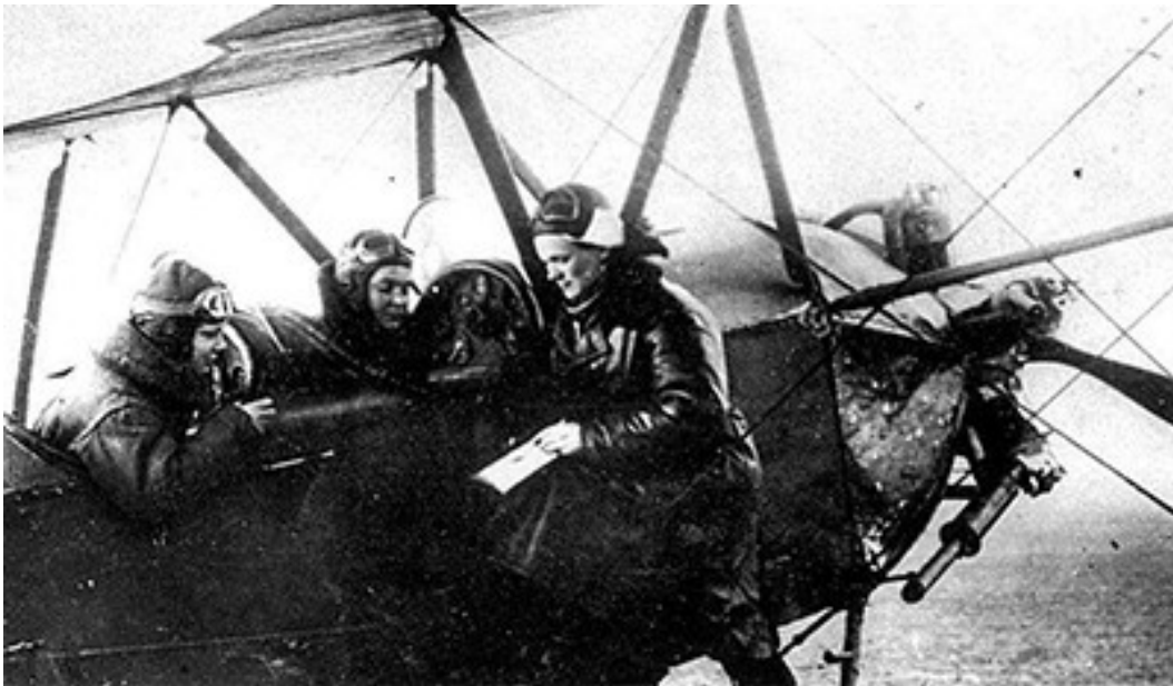
Командир полка Евдокия Бершанская уточняет боевую задачу перед вылетом.

Из материалов газеты "Комсомольская правда" № 282 от 30.11.1943 г.