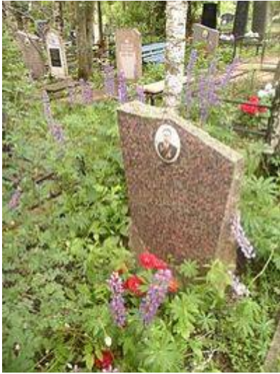
Могила Демченкова на Новом кладбище Смоленска.