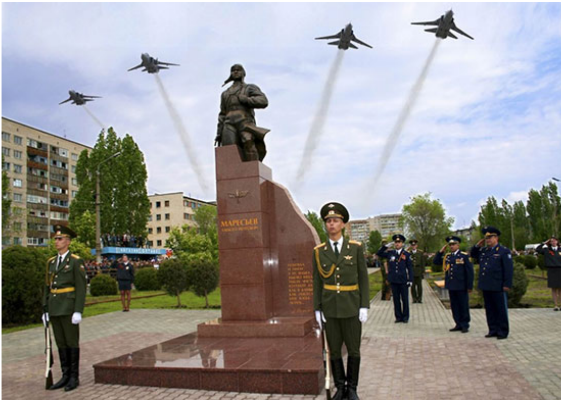
Памятник Алексею Петровичу Маресьеву на его родине в г. Камышин. Скульптор С.А. Щербаков. 2006 г.