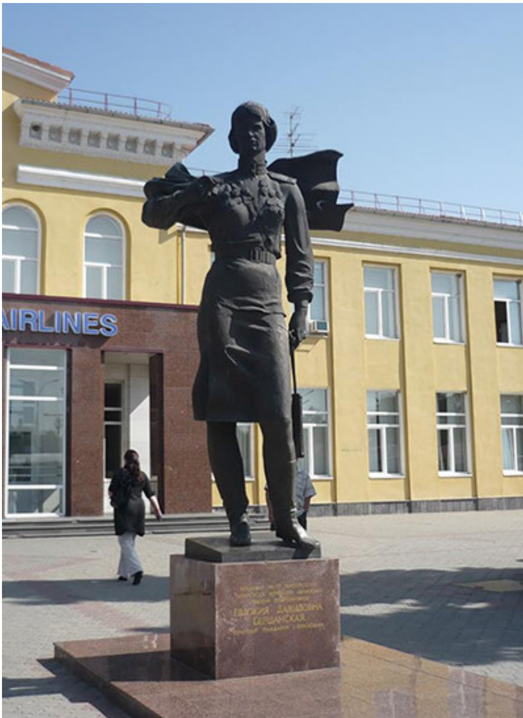
Памятник Бершанской в Краснодаре.