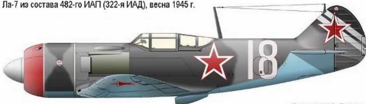
Рисунок М.Ю. Бькова.