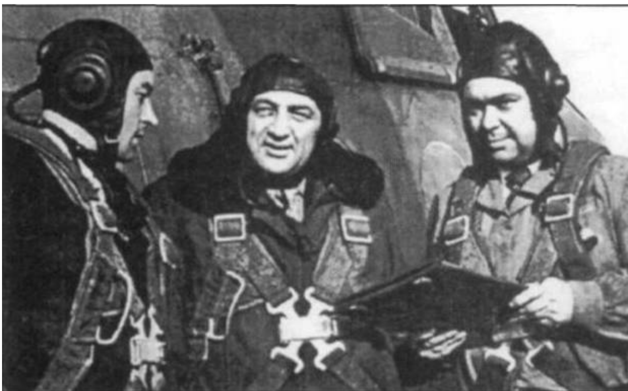
Экипаж вертолета Ми-4 после установления мировой рекорда скорости: летчики-испытатели Б.В.Земсков (справа), Р.И.Капрэлян (в центре) и бортиженер С.Г.Бугаенко.