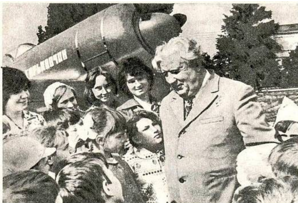
Почетный гражданин города Горького Герой Советского Союза П. Шавурин беседует с посетителями постоянной выставки оружия и боевой техники в Нижегородском кремле.