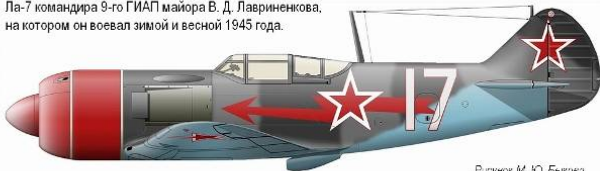
Рисунок М. Ю. Бькова.

Ла-7 командира 9-го ГИАП майора В. Д. Лавриненкова, на котором он воевал зимой и весной 1945 года.