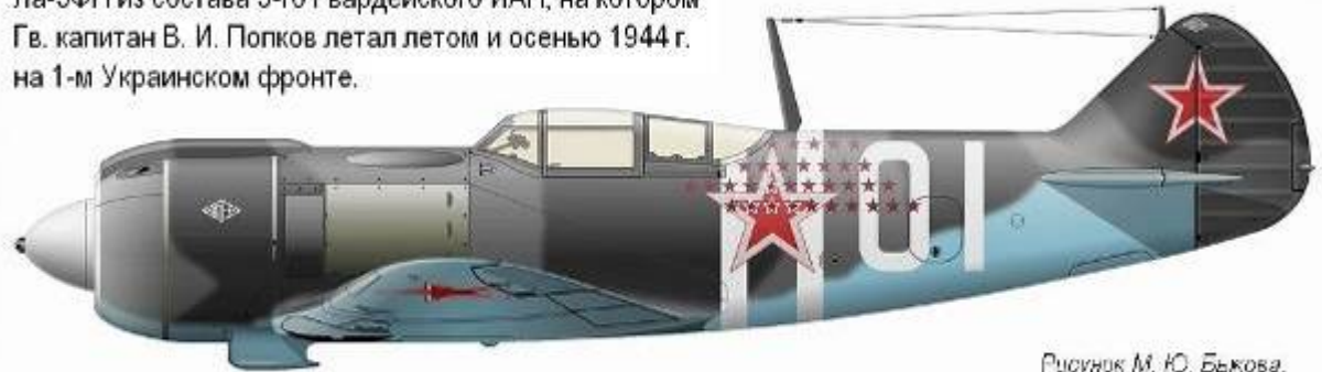
Рисунок М. Ю. Бажова.

Ла-5ФН из состава 5-го Гвардейского ИАП, на котором Гв. капитан В. И. Попков летал летом и осенью 1944 г. на 1-м Украинском фронте.