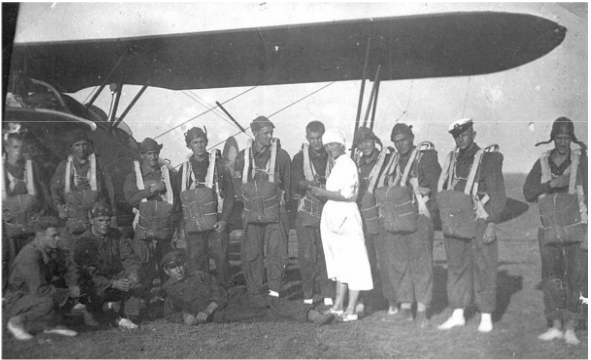
Батайск. 1935 г. Курсанты перед парашютным прыжком.