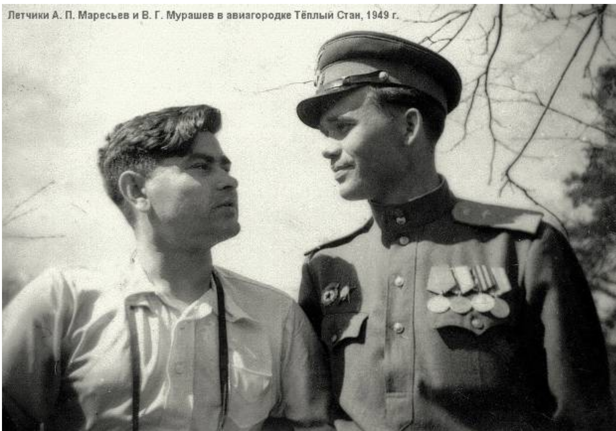
Летчики А. П. Маресьев и В. Г. Мурашев в авиагородке Тёплый Стан, 1949 г.