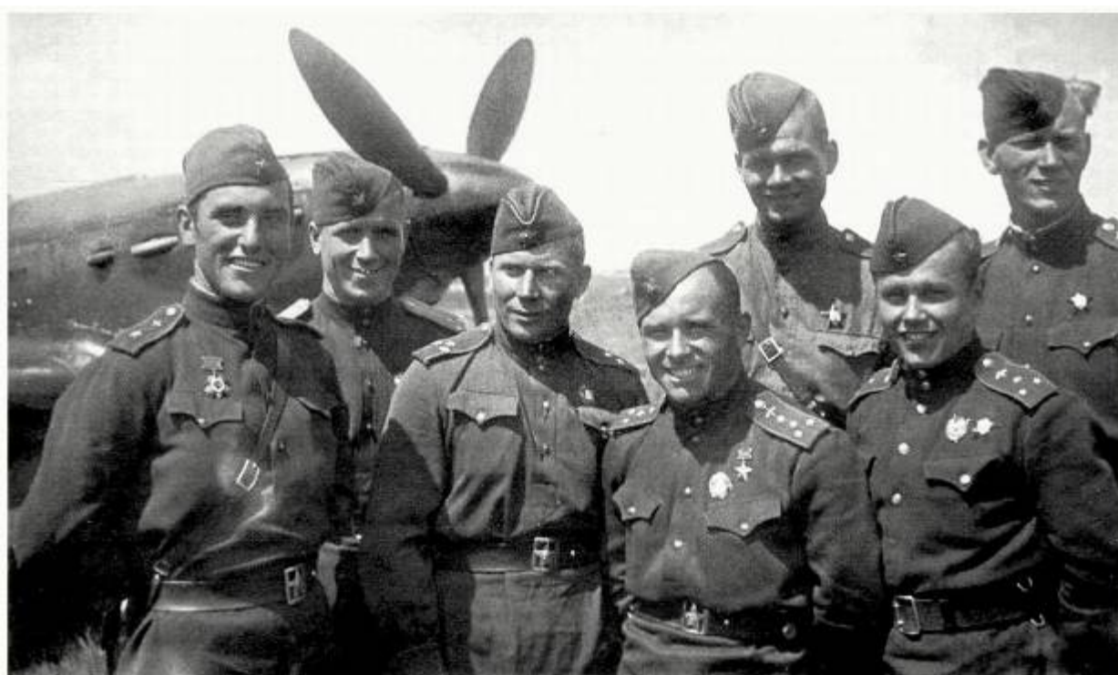
Летчики 910-го иап у Як-1. Четвертый слева — Герой Советского Союза капитан С. К. Коблов.