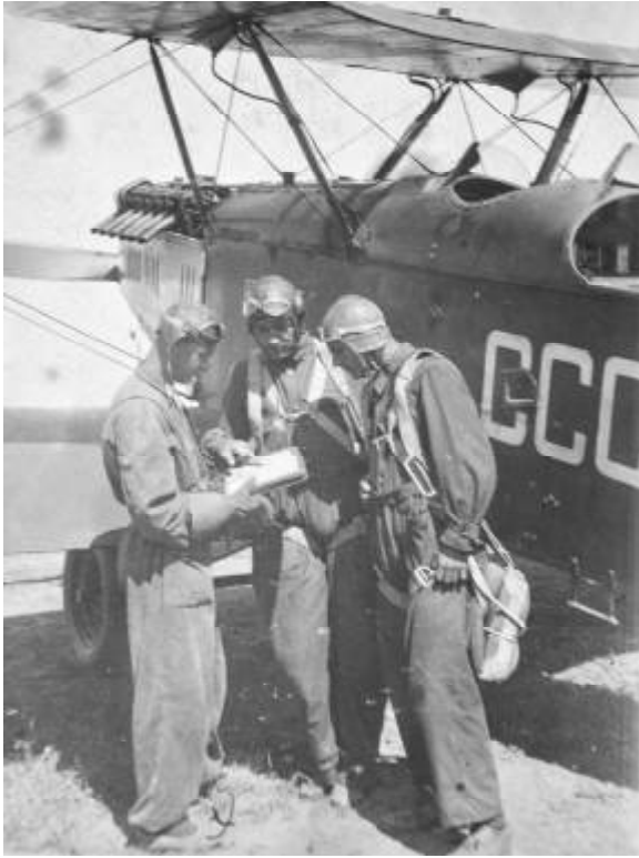
Батайск. Учебный самолет.