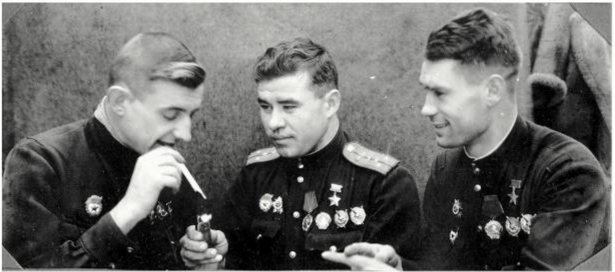
Асы 40-го Гвардейского ИАП (слева направо): И. И. Семенюк, Н. Т. Китаев и К. А. Новиков.

Из материалов газеты "Правда" № 203 от 15.08.1943 г.