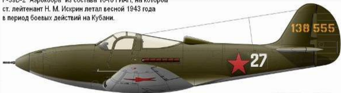
Рисунок М. Ю. Бажова.

Р-39D-2 "Аэрокобра" из состава 16-го ГИАП, на котором ст. лейтенант Н. М. Искрин летал весной 1943 года в период боевых действий на Кубани.