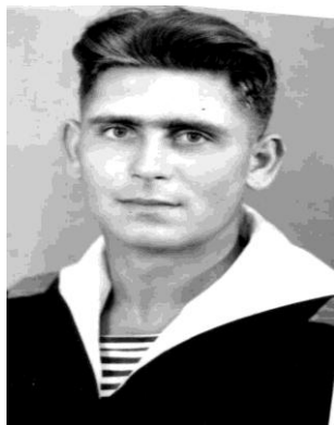
Служба на флоте 1957 г.

Окончил семь классов и стал трудиться. Среднее образование получил в вечерней школе. Поступил также на вечернее отделение - филиала Московского института - пищевой промышленности. Так и вышел в люди. Служил на флоте. Все, что пришлось пережить в военное лихолетье, его не ожесточило. 18 лет руководил профсоюзной организацией города. И когда стал профсоюзным лидером, понимал чаяние людей, помогал им. И они относились к нему с уважением.