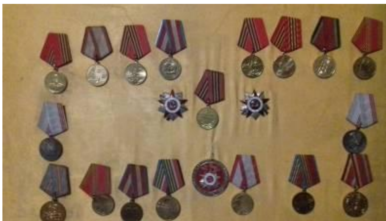
Фото всех медалей семейства Костюковых