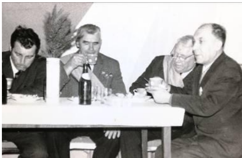
Встреча ветеранов. Батайск 60 годы 20 века.