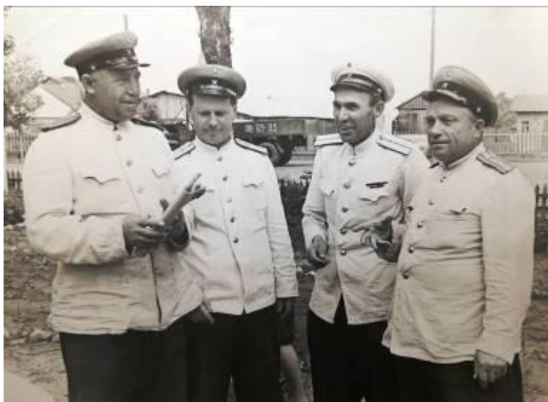
Главный материальный склад СКЖД. Батайск 1960 год.